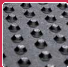
Crampons coniques Souplesse idéale du tapis