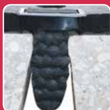
Fixation avec piston caoutchouc

Système de fixation breveté Évite le glissement latéral.