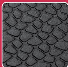
Surface GRIP Meilleure adhérence